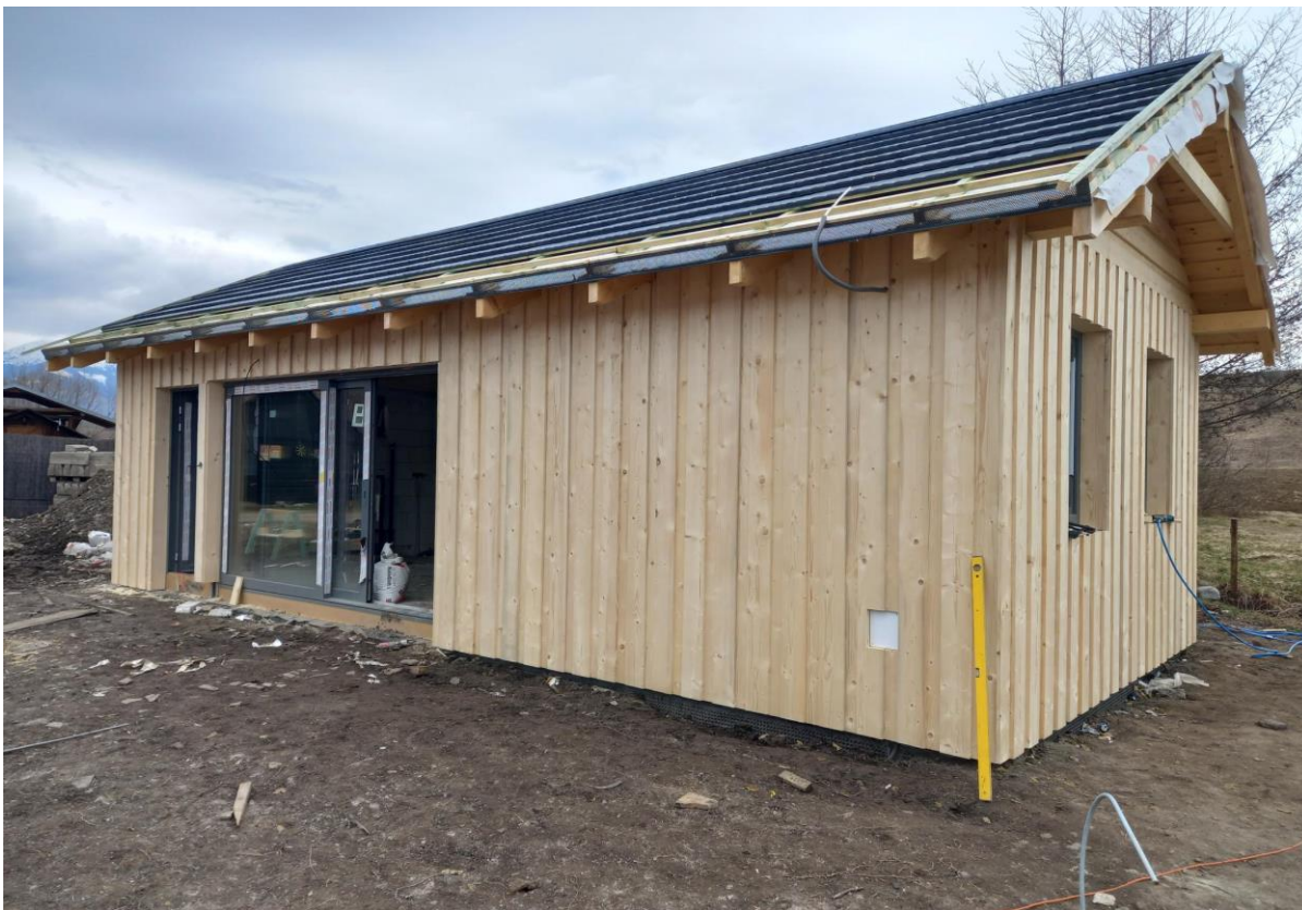
C2/ Fotka č. 1 a 2